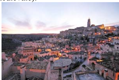
Fig.2: Matera. I Sassi di Matera.

A Matera, il termine è attestato su un privilegio dell'anno 1345 concesso da Caterina, imperatrice di Costantinopoli e principessa di Acaia e di Taranto, alla città di Matera (GATTINI,1882). Sul documento si legge: semel qualibet edomada singulis scilicet diebus lune..... ibidem fit et fieri solet forum seu pannaerium . Questa testimonianza è molto importante, poichè dal documento si deduce che in quel tempo a Matera sussisteva una specie di bilinguismo greco-latino volgare ( forum , latino volgare - pannaerium , greco medievale).