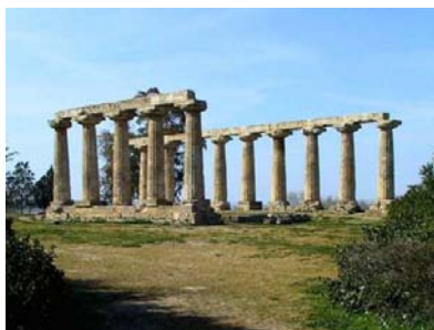
Fig.6: Il Tempio dorico di Era a Metaponto (6° sec. a. C - Bernalda - MT). Luogo sacro dove si tenevano nell' antichità le famose “πανήγυρεις” Cioè “ le feste in onore di Demetra, di Era e di Atena ”