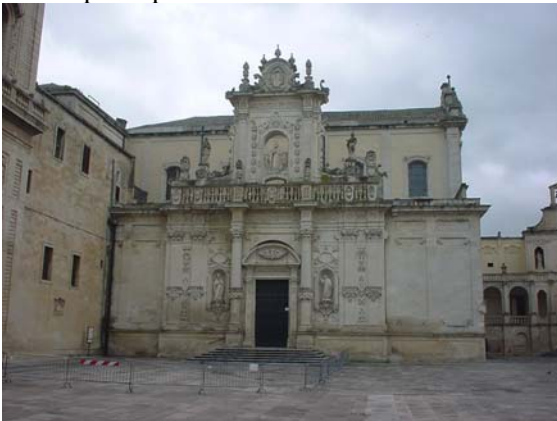
Fig.5: Piazza Duomo a Lecce. E' il luogo dove si svolgeva "il Panaiere"

A Taranto si tenevano durante il XV secolo tre fiere all' anno. La prima in occasione della festa di Sant' Antonio, corrispondente al panière di maggio, attestata anche su un diploma del 1463 relativo alla stessa città, una seconda che veniva indicata con il termine panièrè che durava dal 26 aprile al 4 maggio, fiera che fu istituita dal re Ladislao nel 1407. Esisteva anche la fiera, la terza fiera di Taranto, che corrispondeva al panièrè di Augusto . Essa cadeva il 15 agosto. Precedentemente questa fiera durava dal 24 agosto all' 8 settembre. Quest' ultima fu istituita dal re Federico II di Svevia nel 1234. DE VINCENTIIS (1878 ) si riferisce al disposto della Regina Giovanna II del 4 settembre 1414: " che il paniere di San Pietro in Bevagna si riguardi tra quelle di Taranto non ostante il contrario ".