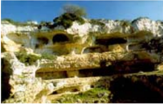
Fig.3:La Gravina (lama) dei Pensieri(Grottaglie - TA)

Infine, una variante dialettale del termine Panaiere , potrebbe essere la forma "Pensieri o Penzieri " attestata in Grottaglie, in provincia di Taranto. Il territorio di Grottaglie è roccioso, brullo, pieno di alture e caratterizzato dalla presenza di numerose gravine e grotte. Nell'antichità fu abitato dai messapi, i quali fondarono le città di Rudia e di Mesòchoron -Μεσόχωρον; (toponimo che corrisponde al toponimo attuale "Masseria Misicùro ". Il toponimo è attestato nel "Lessico" di Esichio e anche sulla "Carta Itineraria Militare Romana", (nota anche come " Tabula Peutingeriana "). Nel "Lessico" di Esichio (SCHMIDT, 1965) troviamo "Μεσόχωρον: luogo dei Messapi depresso a metà, voce greca di Taranto" (Μεσόχωρον: □μιλάμιον μέρος Μεσσαπίων, Ταραντίνου λόγος).